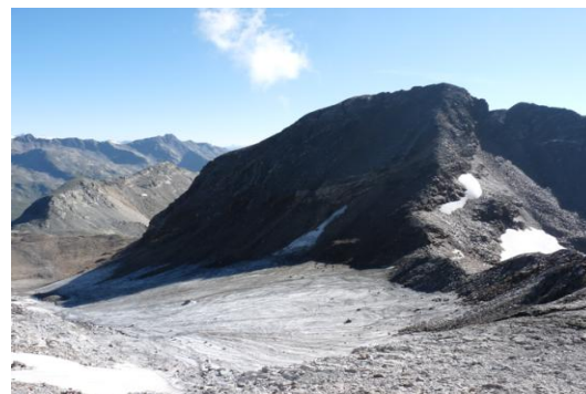
Rosshorn - Rosshornscharte