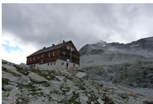
Barmer Hütte – Barmer Spitze