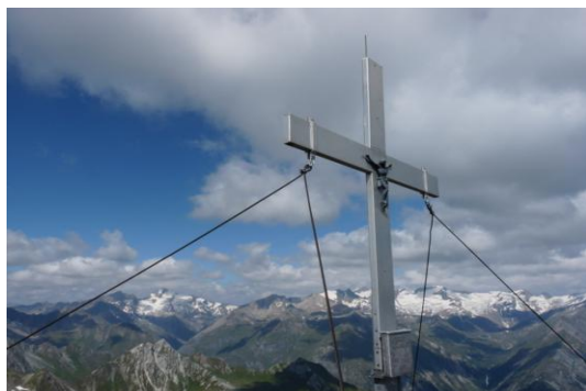
Lasörling (3098m, Gipfel) (Blick zur Venedigergruppe)