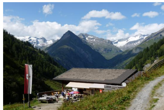
Lasnitzenhütte (1895m) (Blick zum Großvenediger, rechts)