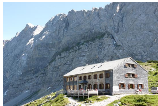
Lamsenjochhütte mit Hochnissl