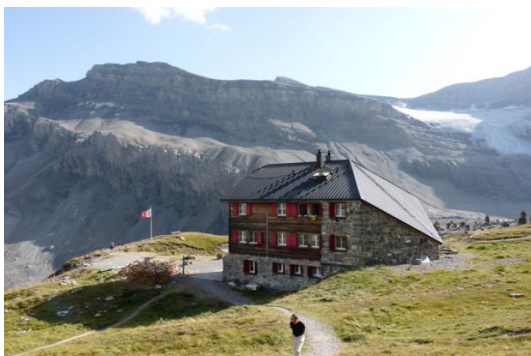
Lämmerenhütte (Blick zum Schwarzhorn)