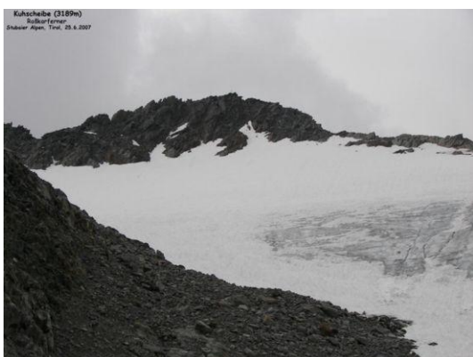
Kukscheibe - Roßkarferner