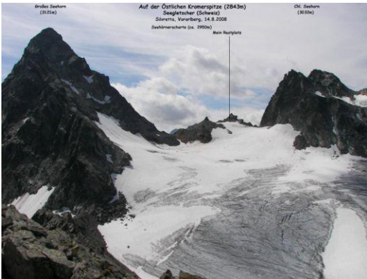
Blick von der Östlichen Kromerspitze zur Seehörnerscharte (Mitte) - Seegletscher Links das Große Seehorn