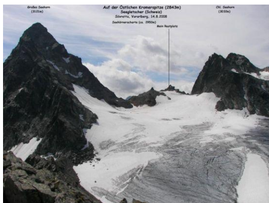
Blick von der Östlichen Kromerspitze zur Seehörnerscharte (Mitte) - Seegletscher Links das Große Seehorn