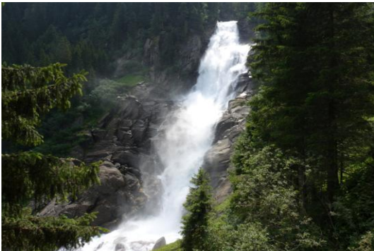
Oberer Achenfall (145m)