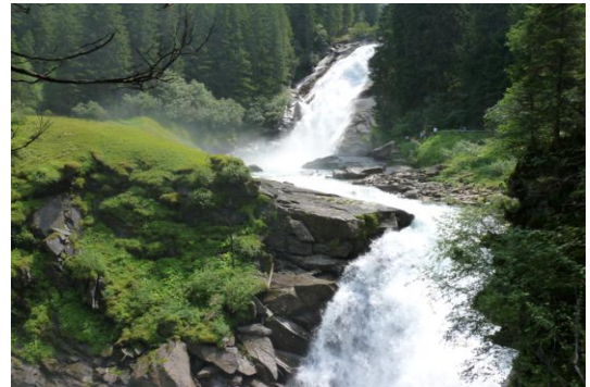
Mittlerer Achenfall (100m)