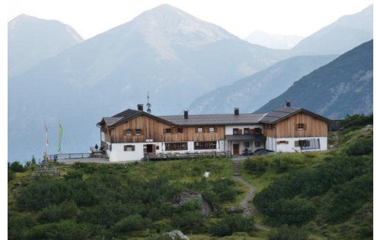
Hanauer Hütte (gegen den Ortkopf)