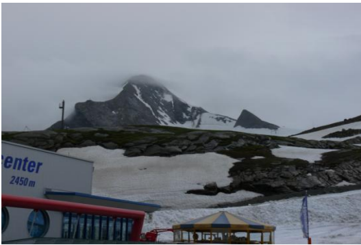
Alpincenter (2446m) - Kitzsteinhorn