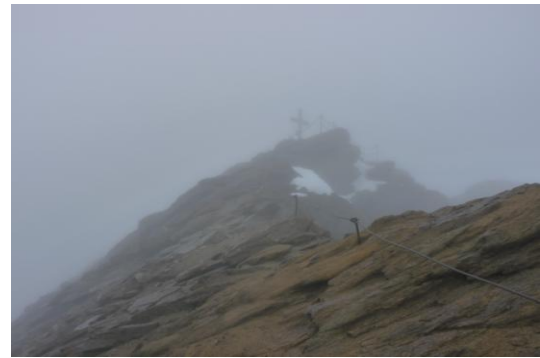
Gipfelgrat zum Kitzsteinhorn