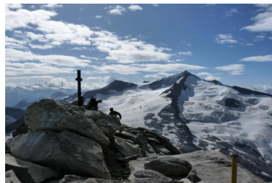
Auf dem Keeskogel (Gipfel) (Rechts der Großvenediger, 3662m)