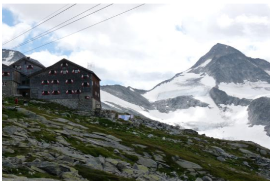
Kürsingerhütte (Rechts der Große Geiger, 3360m)