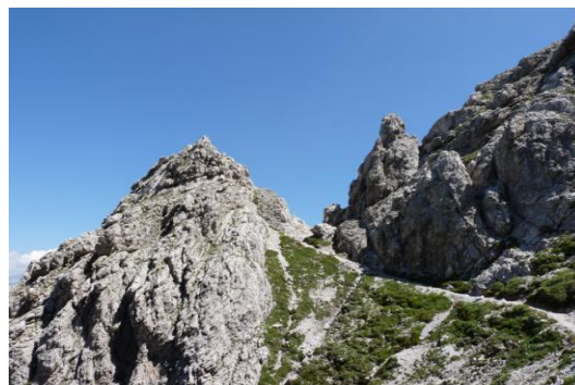
Hohes Törl unterhalb der Laserzwand