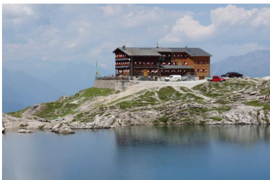
Karlsbader Hütte am Laserzsee