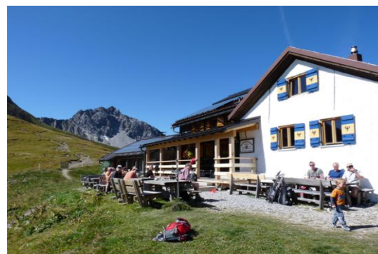
Kaiserjochhaus (hinten Fallesinspitze)