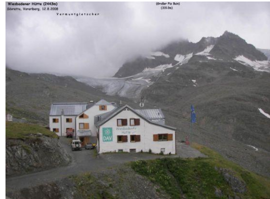
Wiesbadener Hütte (Blick zum Vermuntgletscher)