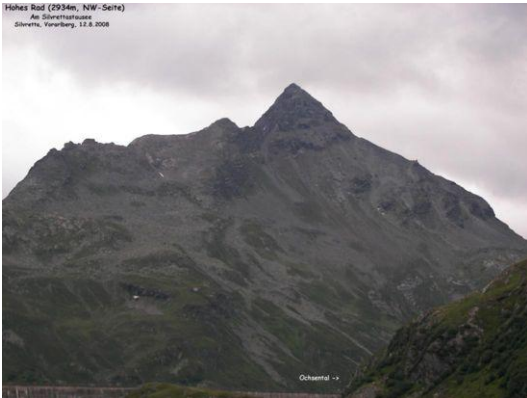
Hohes Rad (Blick von der Bielerhöhe)