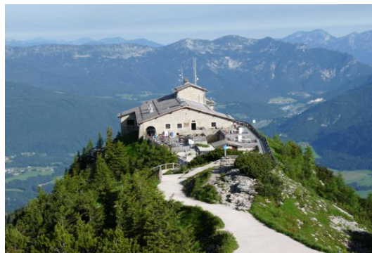
Kehlsteinhaus (Eagle's Nest)