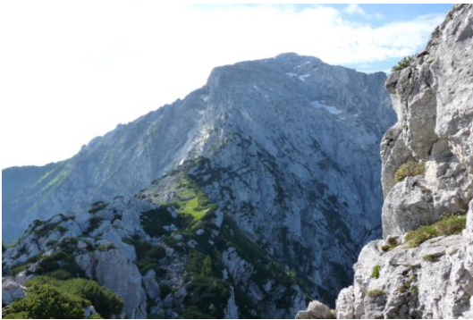
Hoher Göll und der Mannlgrat