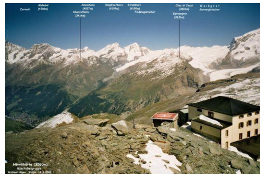
Hörnlihütte (Blick zur Mischabelgruppe)