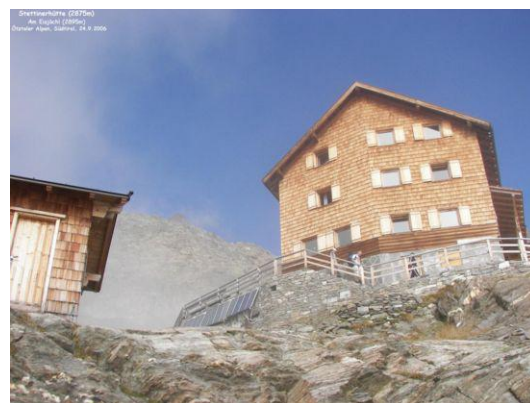
Stettiner Hütte – Rifugio Petrarca (zerstört)