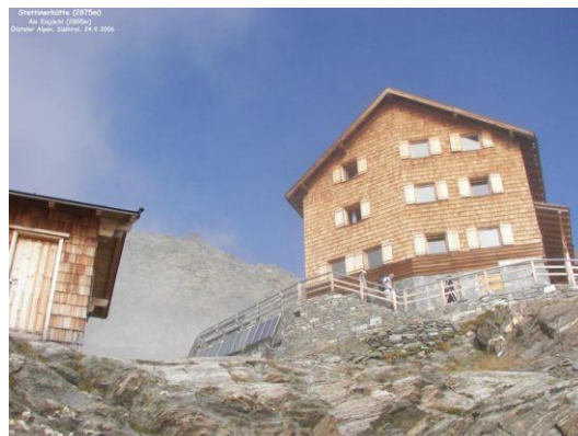
Stettiner Hütte – Rifugio Petrarca