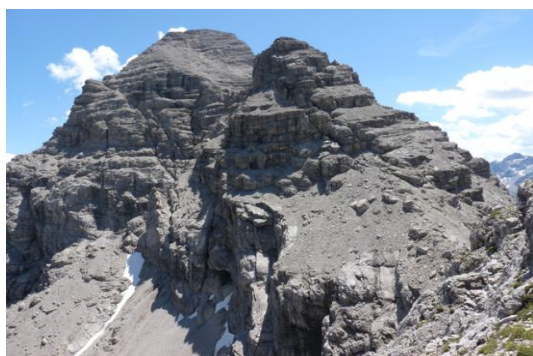
Hochvogel (Blick von Kreuzspitze)