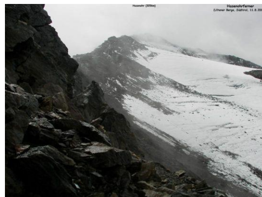
Hasenohr - Hasenohrferner