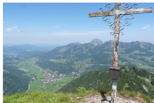
Kleiner Traithen (Blick zum Wendelstein)