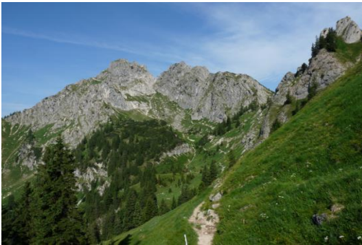
Große Klammspitze (links)