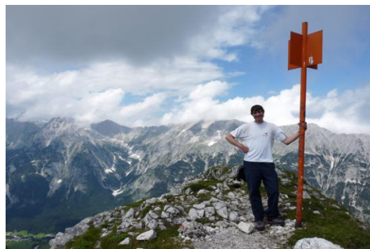
Grosse Arnspitze (Gipfel)