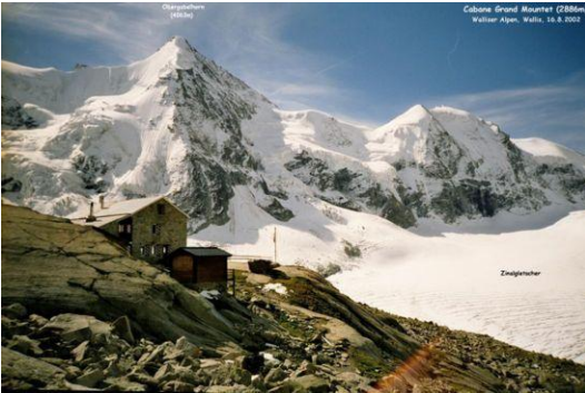
Cabane du Grand Mountet (Blick zum Obergabelhorn)