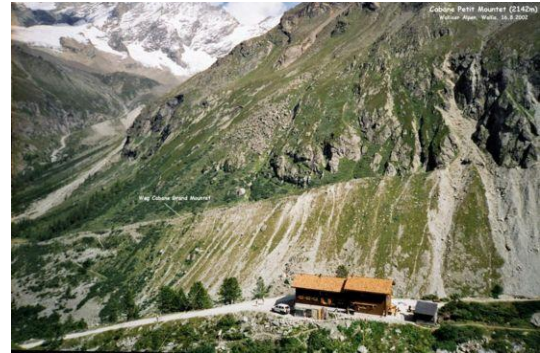
Cabane Petit Mountet (Im Hintergr. Weg zur Cab. Grand Mountet)