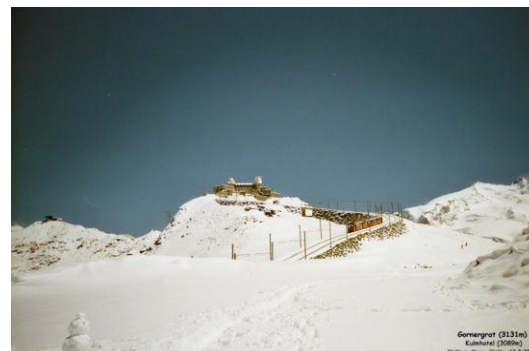
Blick zum Gornergrat - Kulmhotel