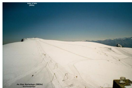
Auf dem Klein-Matterhorn (Blick zum Gobba di Rollin)