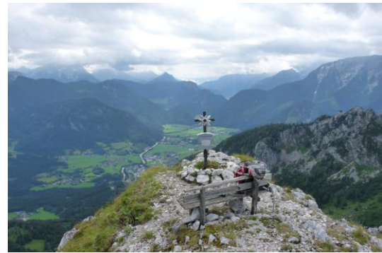
Gföllhörndl (Blick nach Lofer)