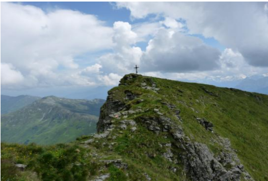
Geißstein – Der Westgrat