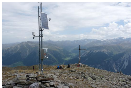
Elferspitz (Blick zum Langtaufferer Tal)