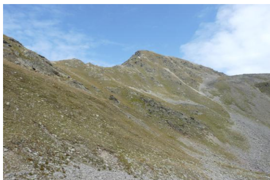
Elferspitz (beim Aufstieg)