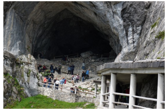
Eingang zur Eisriesenwelt