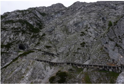
Weg Bergstation / Dr. Oedl Haus zum Höhleneingang