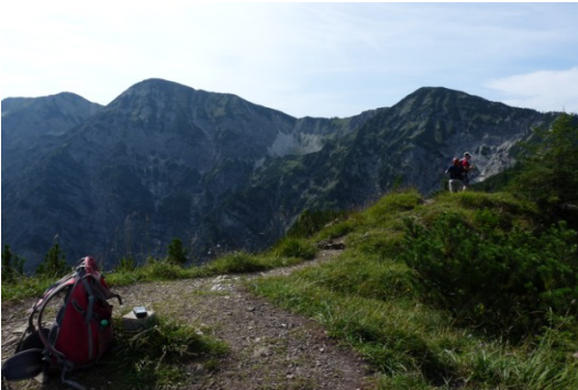
Demeljoch – Dürrbergjoch (Ganz links: Zotenjoch)