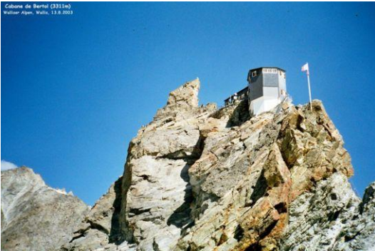
Cabane de Bertol Blick vom Col de Bertol