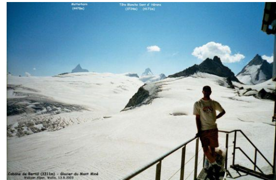
Aussicht an der Cabane de Bertol Glacier du Mont Miné – Matterhorn (links)