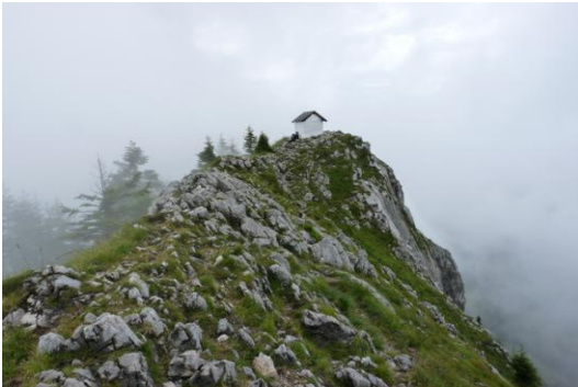
Brünnstein (Ostgipfel) - 1619m