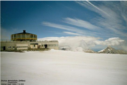
Mittelallalin (Endstation Metro-Alpin)