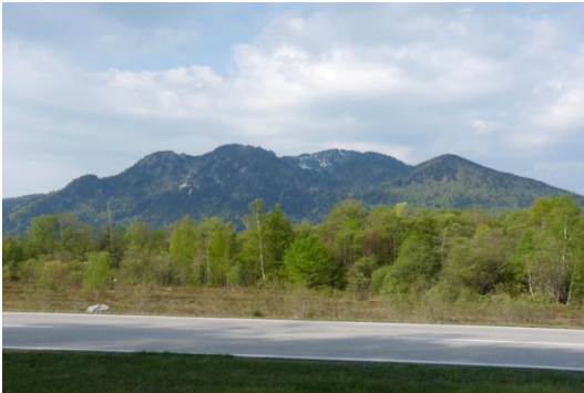
Brauneck (bei Lenggries)