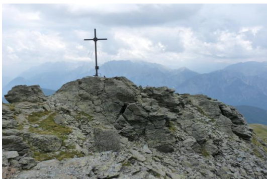
Böses Weibele (Hintergrund: Lienzer Dolomiten)