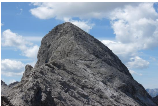
Bockkarkopf (von der Bockkarscharte)