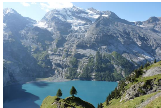
Oeschinensee (Doldenhorn, 3638m)