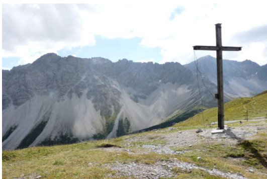
Steinjöchl (Blick nach Süden)