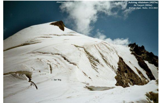
Allalinhorn (Westseite) Blick vom Feejoch