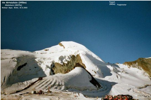
Allalinhorn (Nordseite) Blick vom Mittelallalin