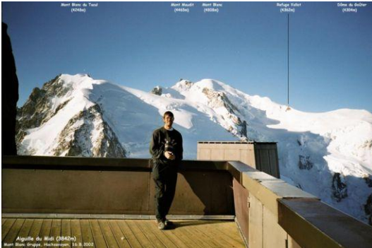
An der Aiguille du Midi (Blick zum Mont Blanc)