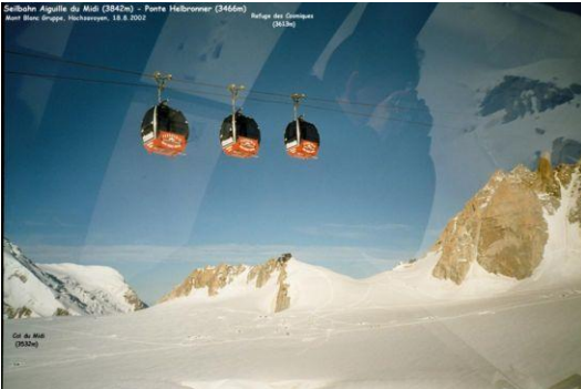
Blick zum Refuge des Cosmiques (3613m) Col du Midi (3532m)