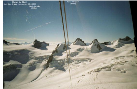
Fahrt zum Ponte Helbronner Der riesige Glacier du Géant