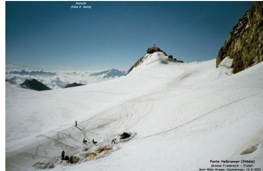
Seilbahnfahrt zum Ponte Helbronner